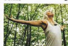
Klinik wWersbach 44