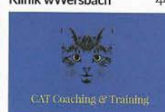
Dolores Holzer 58