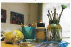
Janus Klinik 48