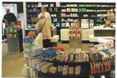
St. Johannis Apotheke 33