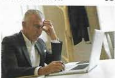
Les Papillion Bleu 52